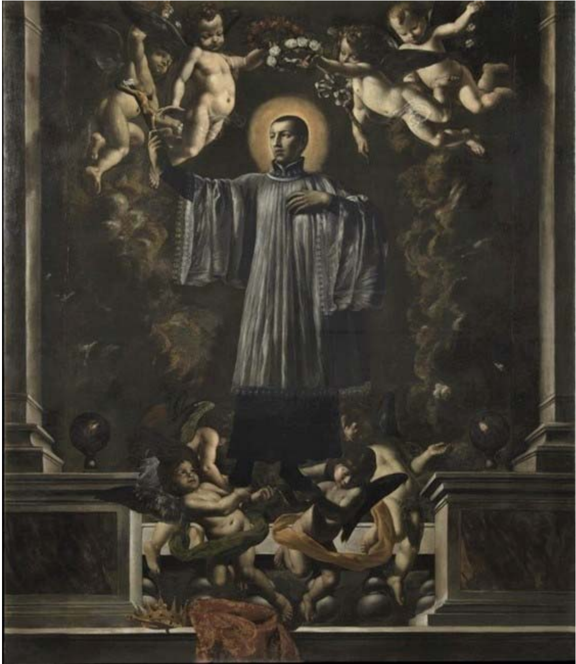
Battistello Caracciolo, Gloria di S. Luigi Gonzaga, 1627, Chiesa del Gesù Vecchio, Napoli