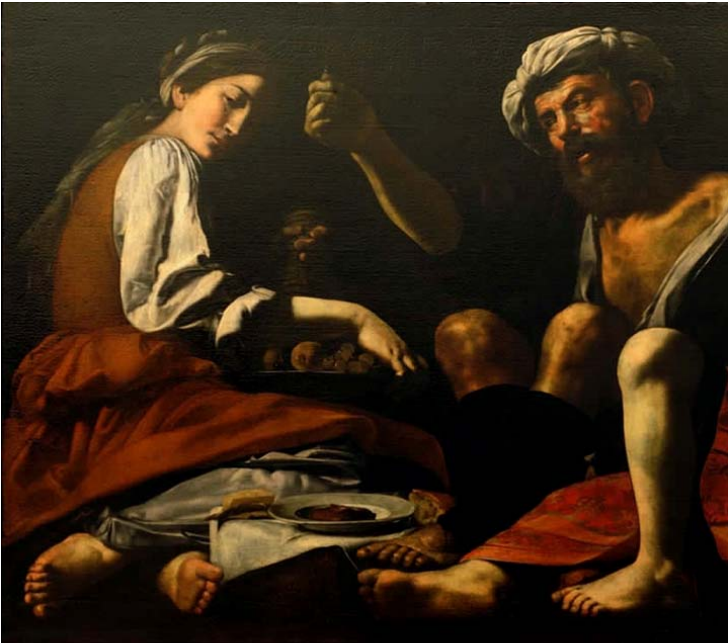
Battistello Caracciolo, Lot e le figlie, olio e tempera su tavola, 1625 ca. – Galleria Nazionale delle Marche