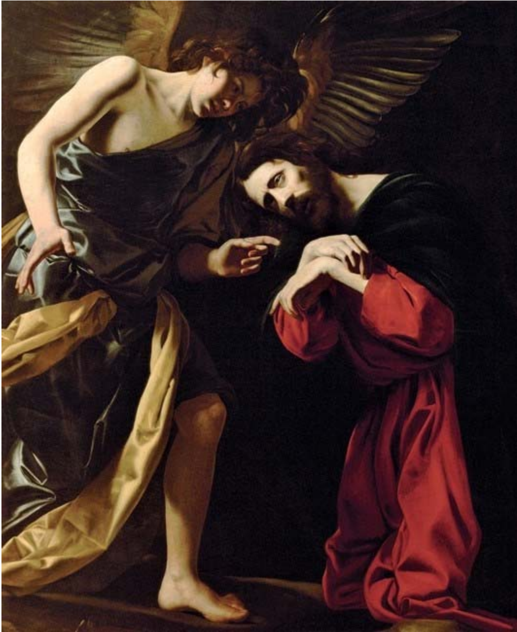
Battistello Caracciolo, Cristo soccorso dall'angelo, 1615-17, Kunsthistorisches Museum, Vienna