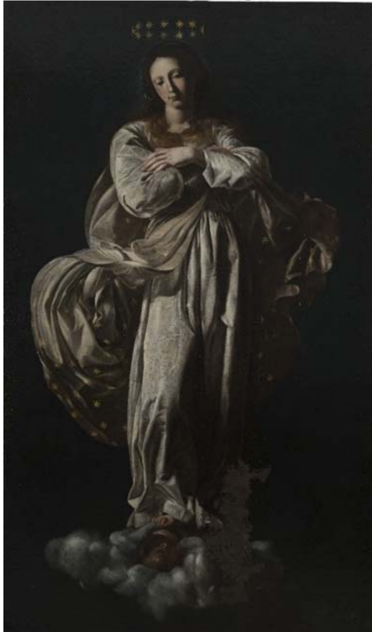
Battistello Caracciolo, Immacolata Concezione, 1627 ca, Chiesa della Natività della Beata Maria Vergine, Roccadaspide (Sa)