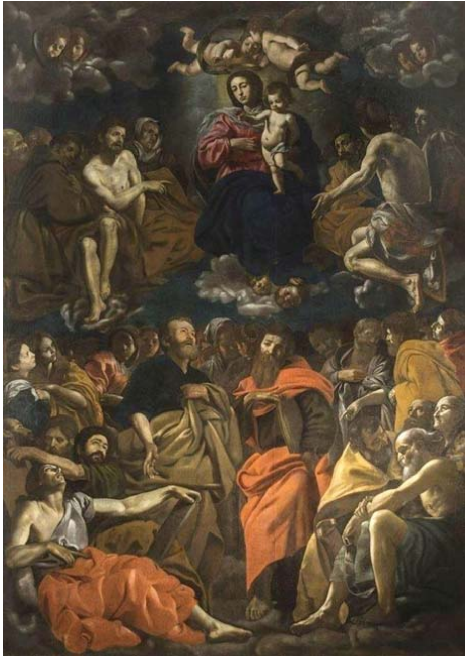
Battistello Caracciolo, Madonna col Bambino e Santi, Colleggiata di S. Maria di Ognissanti, Stilo (RC)