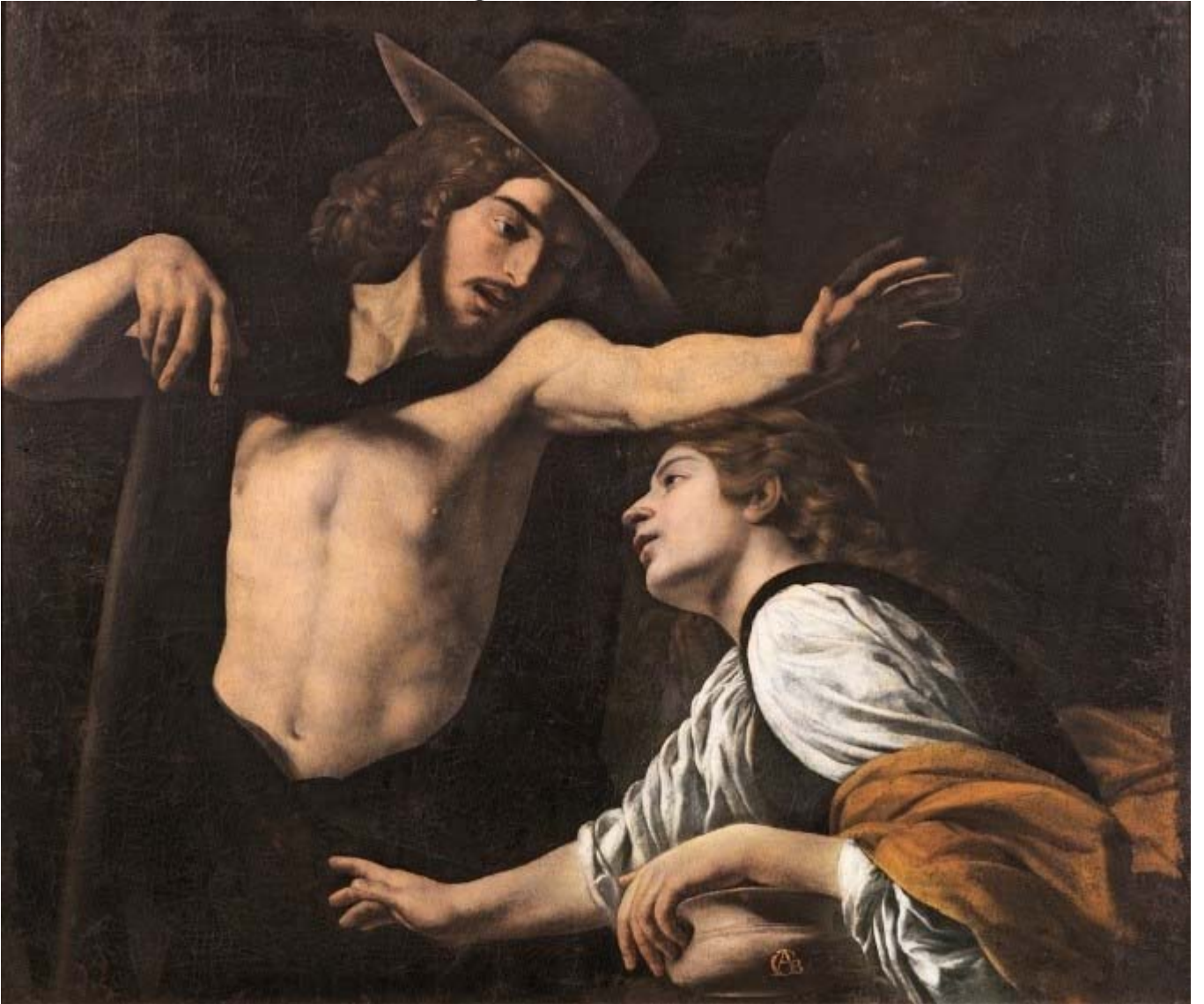
Battistello Caracciolo, Noli me tangere, 1618, Museo di Palazzo Pretorio, Prato

Battistello Caracciolo, panoramiche delle sale della mostra