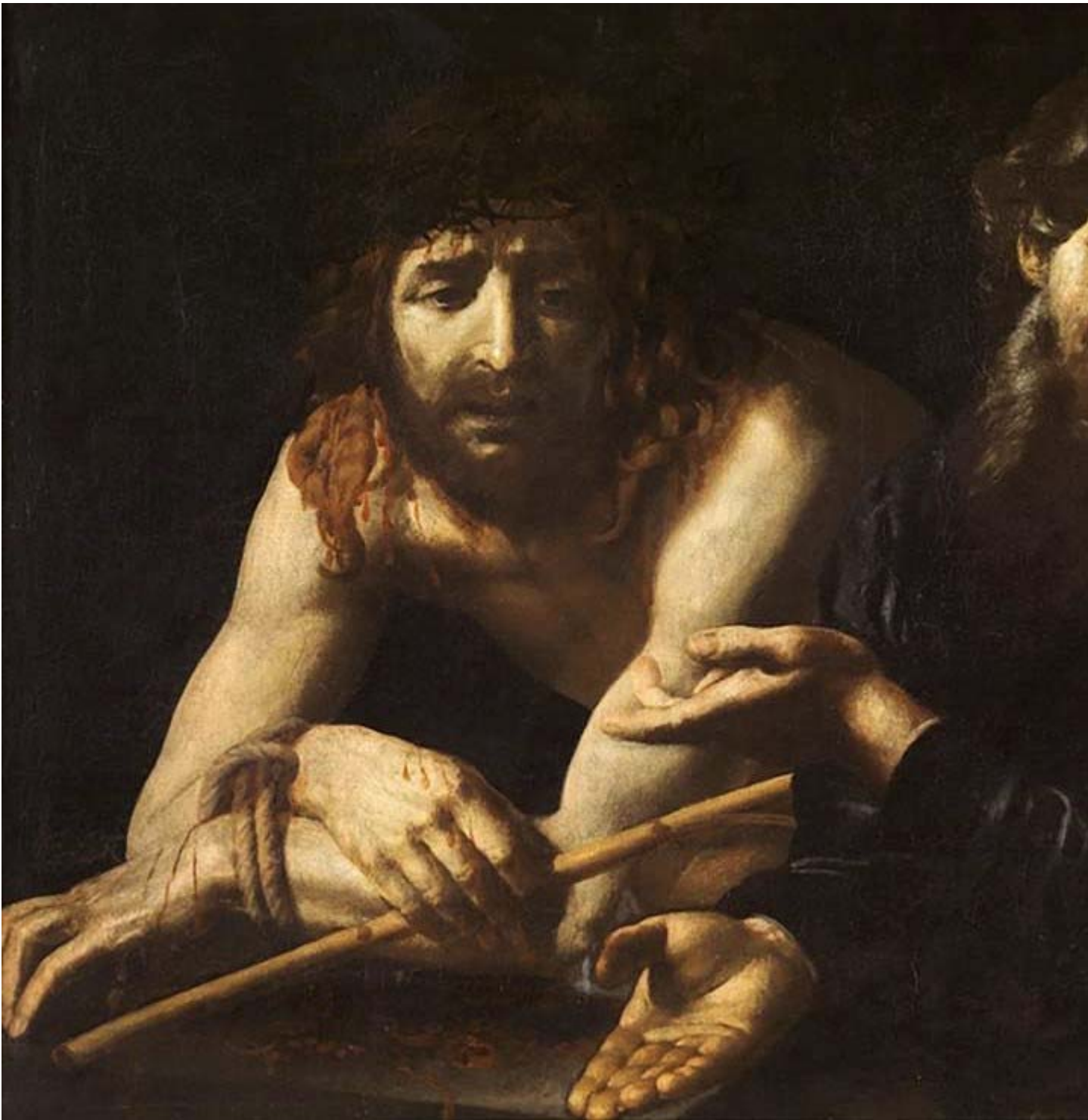
Battistello Caracciolo, Ecce Homo