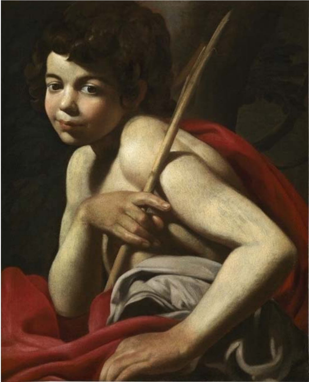
Battistello Caracciolo, San Giovanni Battista fanciullo, 1622 ca., Fondazione Giuseppe e Margaret De Vito, Vaglia (FI)