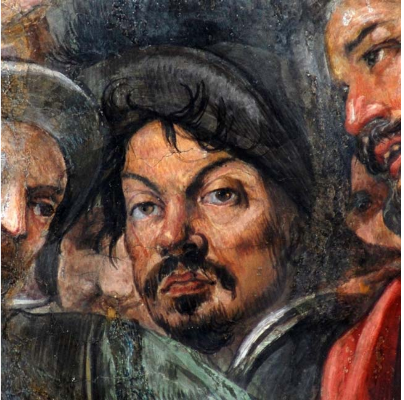
Battistello Caracciolo, Ritratto di Caravaggio, particolare degli affreschi di Palazzo Reale, 1611, Napoli